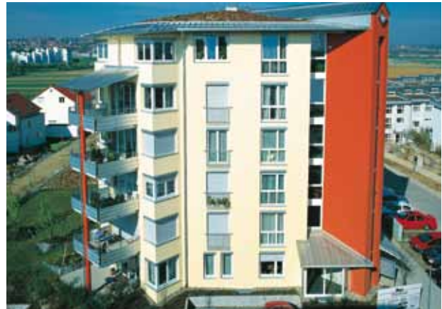
Wohnanlage Bonlanden, Filderstadt (D)

Bauphysikalisch bietet die diffusionsoffene Dachhaut aus Aluminium-Stehfalztafeln maximale Sicherheit. Eine Zertifizierung nach DGNB ist möglich.